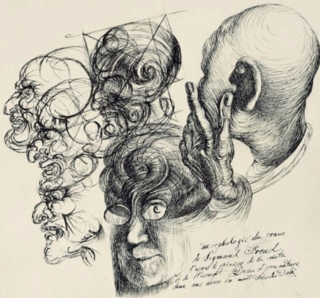
Immagine: "Portrait of Freud" di S. Dalí

Associazione lacaniana internazionale Torino